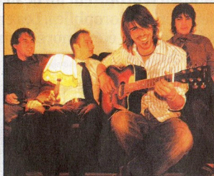
Premier disque pour le groupe Pitchers. LDD

Voilà dix ans déjà que les Pitchers font résonner leurs notes sur les scènes de la région. D'abord dans un registre punk rock bien musclé, les musiciens, qui ont créé le groupe à Bex, ont bifurqué sur la voie du rock français.